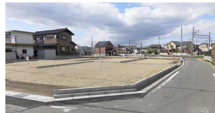
清須市土田郷上切の売地は坪48万、坪49万で成約しています。

5㎡以上道路の住宅地で、地価が高い土田、花木では坪48万～49万円もあれば、地価の安い所は坪20万～21万円と2.3倍の開きがあります。新しく宅地開発された整理区域は高く、昔からの土地は少しずつ安くなり二極化しています。