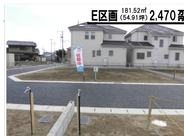
E区画 181.52㎡ (54.91坪) 2,470万円