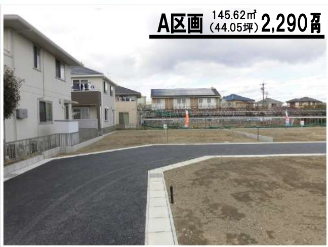
A区画 145.62㎡ (44.05坪) 2,290万円