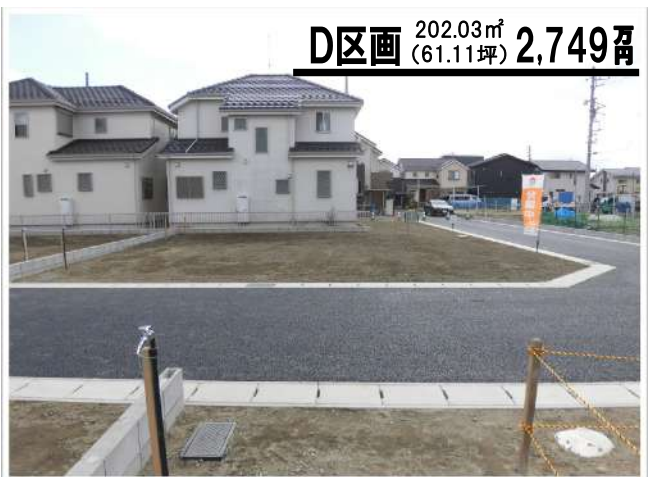
D区画 202.03㎡ (61.11坪) 2,749万円