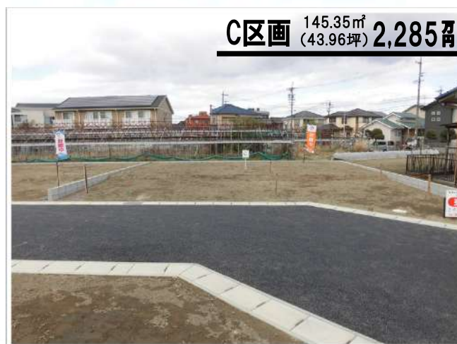
C区画 145.35㎡ (43.96坪) 2,285万円