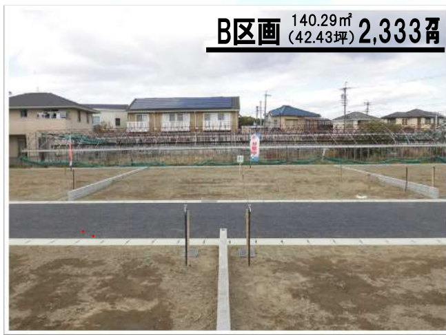
B区画 140.29㎡ (42.43坪) 2,333万円