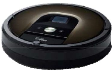
iRobot iRobot ルンバ