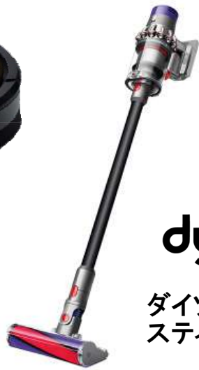
dyson ダイソン スティッククリーナー