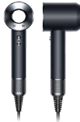
dyson ダイソン ヘアドライヤー