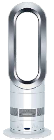
dyson ダイソン ホット+クール